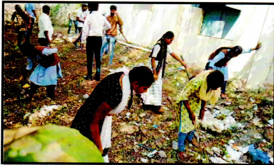
Cleaning School Premises in adopted village