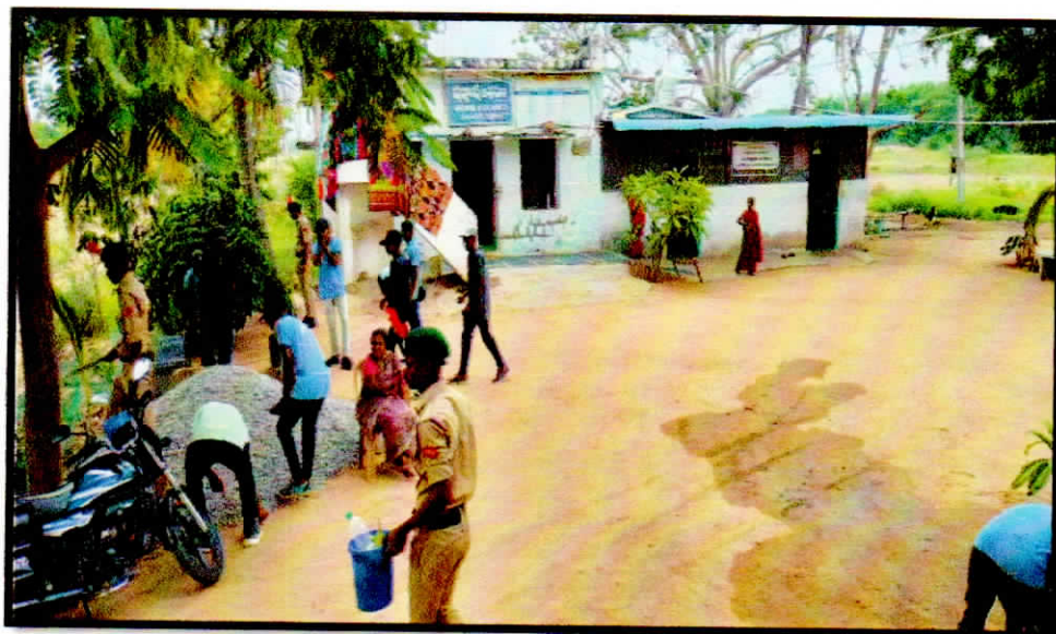
Cleaning the premises at the Old age Home

Health care for Girls – Haemoglobin test: